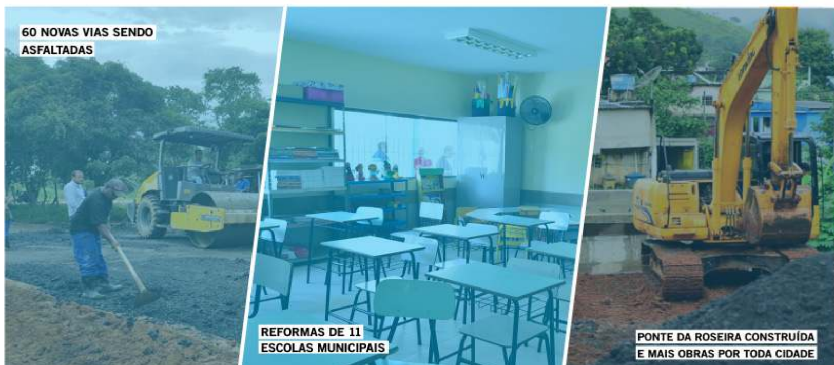
60 NOVAS VIAS SENDO ASFALTADAS